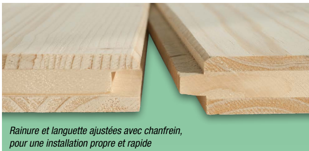
Rainure et languette ajustées avec chanfrein, pour une installation propre et rapide