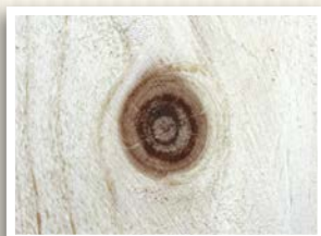
chevillage pour bois naturel vita

Le bois est issu exclusivement de notre propre fabrication contrôlée et de forêts exploitées selon les critères du développement durable (PEFC). Sur demande de la clientèle, vita peut être livré avec certification PEFC ou désormais aussi avec certification FSC et l'Ange Bleu.