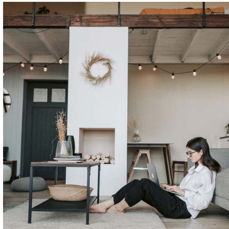
Vita grundiert im Deckenbereich