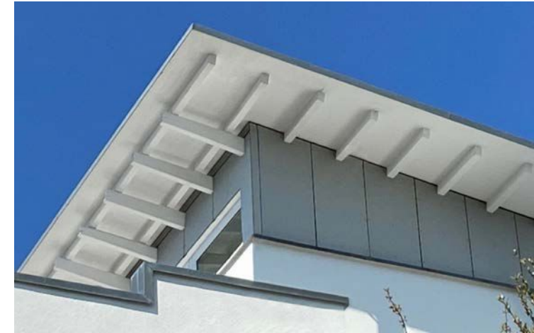
Vita grundiert im witterungsgeschützten Dachvorstand

Ergänzt wird Vita Grundiert mit einem umfangreichen Gesamtsortiment an weiteren emissionsarmen Holzwerkstoffplatten. Damit fällt einem in den eigenen vier Wänden garantiert nicht die Decke auf den Kopf!